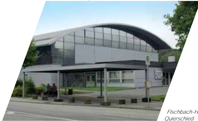
Fischbach-Halle in Quierschied