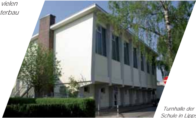
Turnhalle der Kopernikus-Schule in Lippstadt