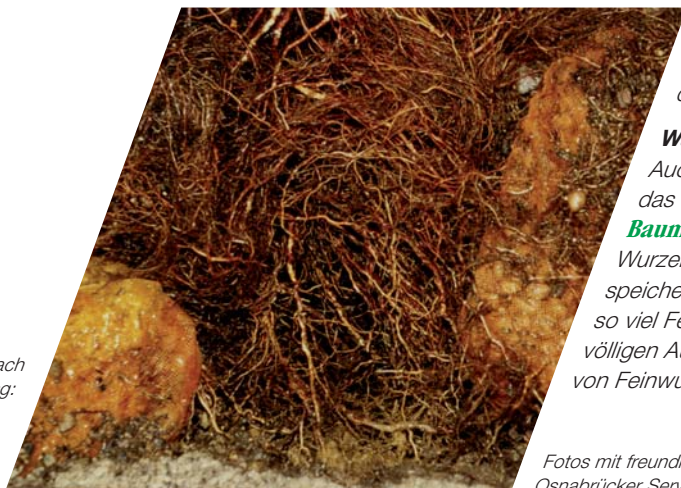
Ca. 2 Jahre nach Baumpflanzung:

Auch bei stark verdichtetem Boden gelangt das Gieß- oder Regenwasser durch den BaumSchnorchel ungehindert bis tief in den Wurzelraum. Der Blähton im BaumSchnorchel speichert auch über längere Trockenzeiten noch so viel Feuchtigkeit, dass die Gefahr des völligen Austrocknens und Absterbens von Feinwurzeln gebannt ist.