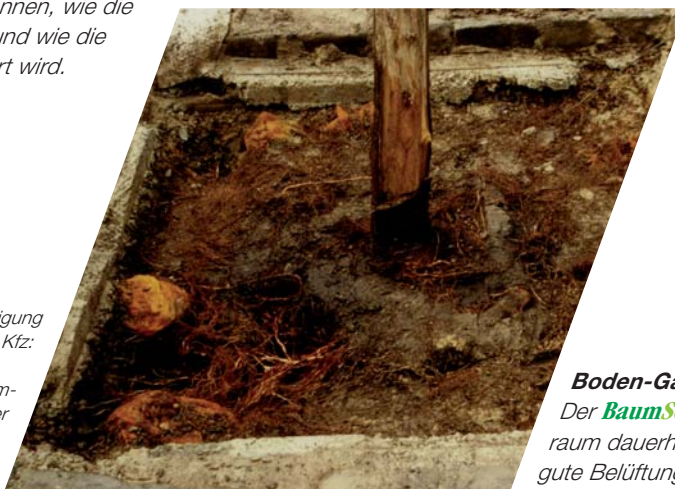
Nach Baumschädigung durch ein Kfz:

Vorbereitete Baumgrube vor der Baumpflanzung. Anordnung der BaumSchnorchel