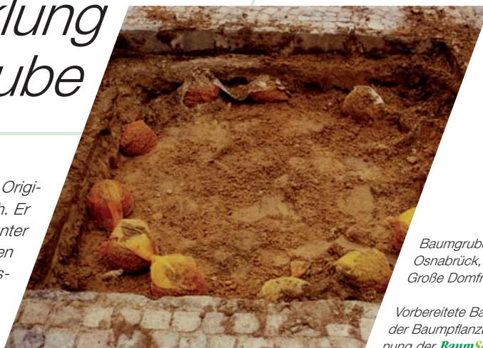
Baumgrube in Osnabrück, Große Domfreiheit:

Auf diesen Beispielfotos ist zu erkennen, wie die BaumSchnorchel platziert werden und wie die Wurzelentwicklung durch sie gefördert wird.